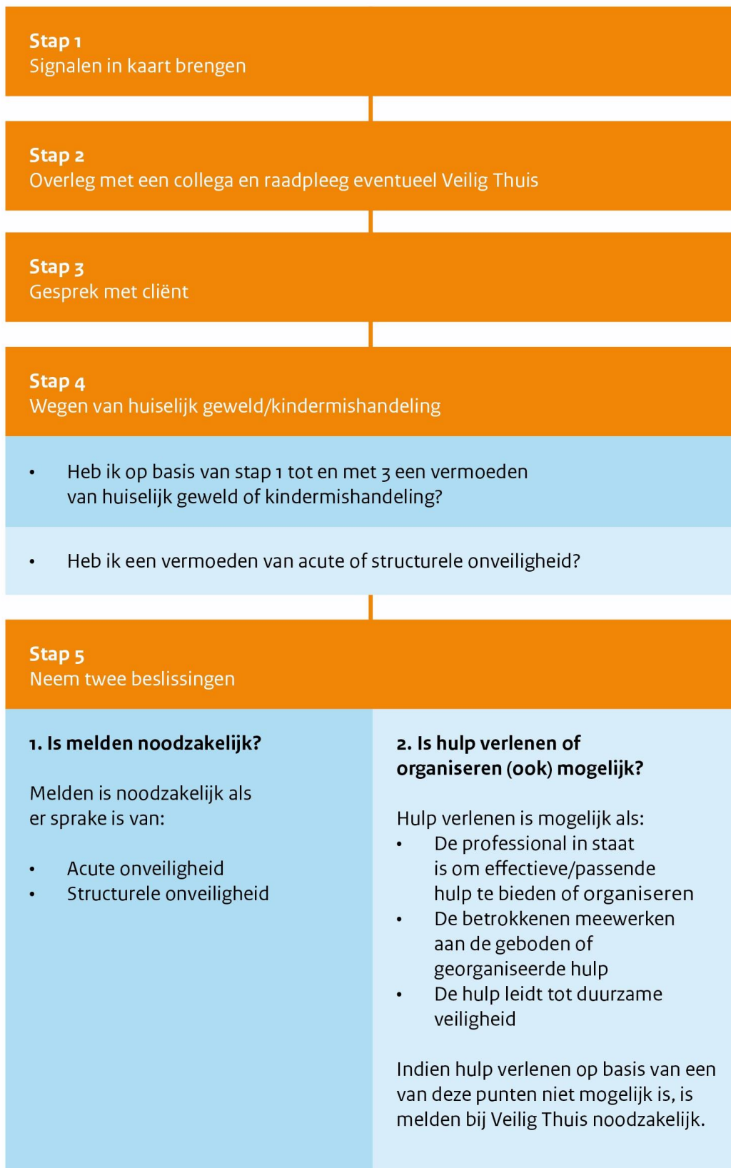
Figuur 1: Stappenplan verbeterde meldcode